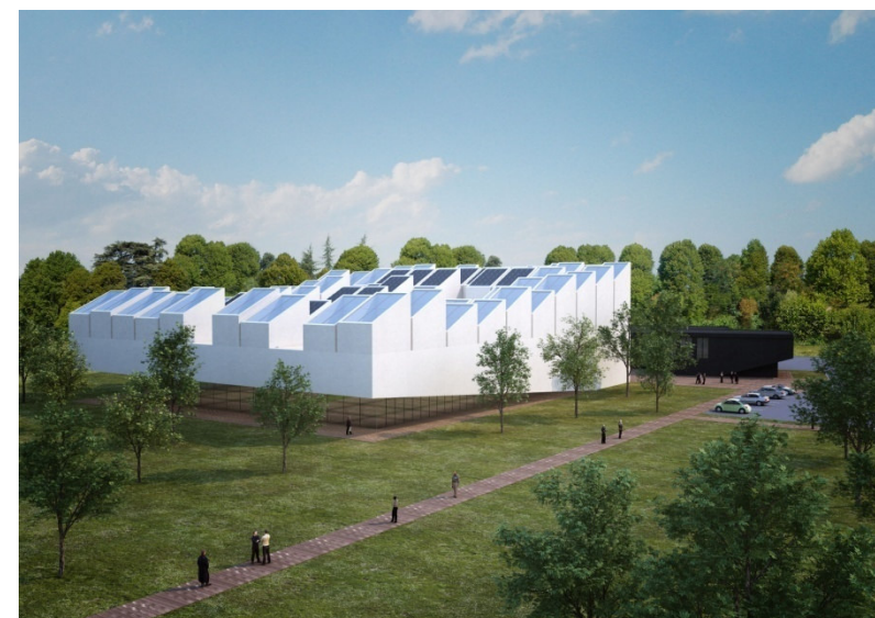
Vista aerea da sud